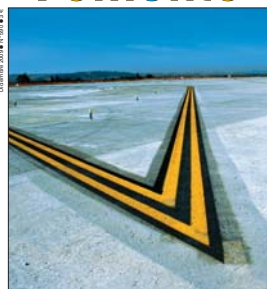
Plan de Acción Medioambiental en aeropuertos ● Autovía Extremadura-Comunidad Valenciana ● Corredor ferroviario Cantábrico-Mediterráneo ● Plan de vialidad invernal