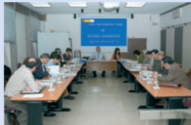
Reunión 12ª de la CENG celebrada el 12 de marzo de 2008

Forman parte de ella representantes de autoridades en nombres geográficos de la Administración General del Estado y de las Comunidades Autónomas, así como de universidades, academias de las lenguas y otras instituciones relacionadas con la toponimia.