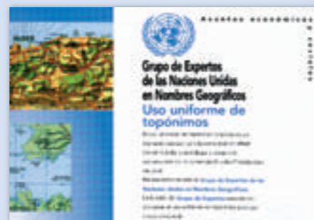
Folleto informativo de las Naciones Unidas

Las Conferencias de las Naciones Unidas sobre la Normalización de los Nombres Geográficos (que se celebran cada cinco años desde 1967) recomiendan que exista en cada país un órgano nacional de nombres geográficos, que coordine a los distintos organismos competentes en esta materia para conseguir una verdadera normalización a nivel estatal, previa a la internacional.