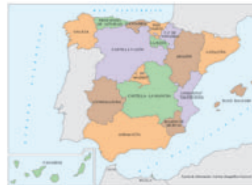
División autonómica de España

La normalización de la toponimia en España ha de tener en cuenta la existencia de diferentes lenguas vivas en su territorio y la riqueza lingüística que este hecho supone. Los topónimos pueden estar normalizados en castellano, lengua oficial de España, en las lenguas cooficiales propias de determinadas Comunidades Autónomas (gallego, euskera, catalán o valenciano, y aranés) o en otras lenguas y dialectos (asturiano, leonés, aragonés), sin olvidar los rasgos de habla que muchas veces se reflejan en la toponimia.