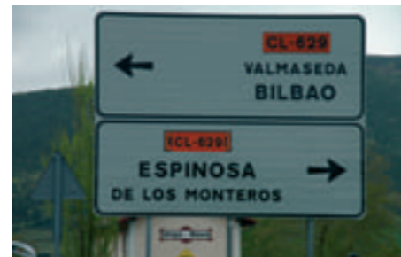
Ejemplo de uso incorrecto de un topónimo en la señalización viaria: el nombre oficial es Balmaseda

El uso de nombres normalizados es imprescindible para identificar inequívocamente un lugar. Por ello, es especialmente importante su utilización en las Administraciones públicas, medios de comunicación, cartografía, sistemas de información geográfica, señalización viaria y publicaciones.