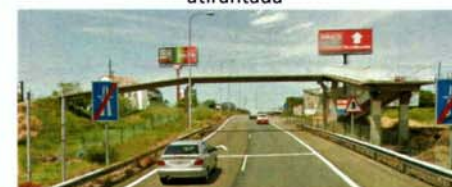
Pasarela a demoler en el enlace AP-9