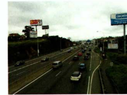
Vista salida de la ciudad hacia AP-9 desde pasarela actual en el Núcleo de Elviña