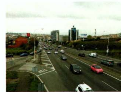
Vista entrada a ciudad desde pasarela actual en el Núcleo de Elviña