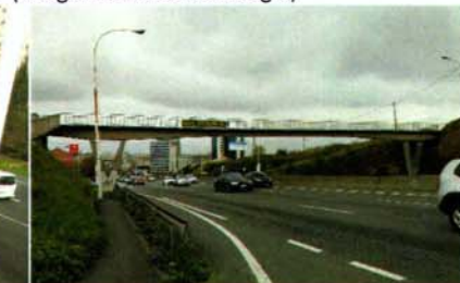
Pasarela a demoler núcleo Elviña