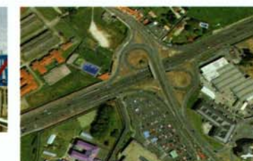
Enlace con N-550 y futura ubicación pasarela Pedralonga