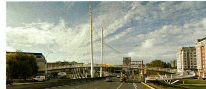
Pasarela atirantada a mantener