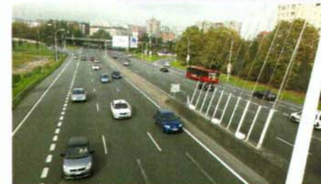
Vista enlace con carretera AC-10 desde pasarela atirantada