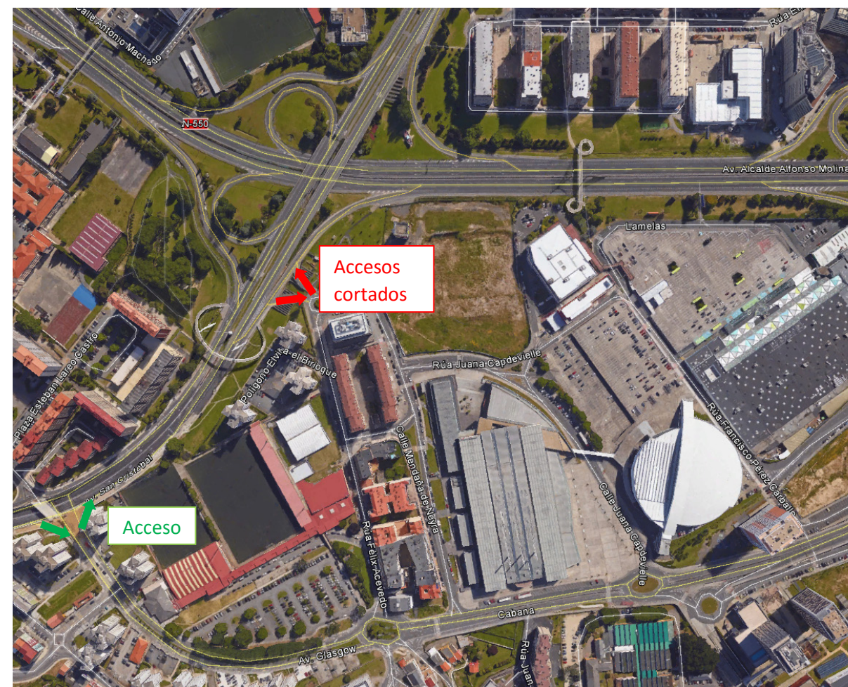
El acceso en la calzada derecha (sentido salida de la ciudad) a las casas de A Pereiroa se mantiene, siendo necesario cruzar la senda peatonal para acceder a dichas viviendas.

Dichas conexiones se realizarán en el futuro por la salida anterior situada hacia el oeste, a través de la Avenida Glasgow.