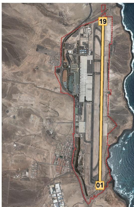
Ilustración 1. Localización de pistas y umbrales en el Aeropuerto de Fuerteventura

La figura siguiente representa la disposición de la pista y de cada uno de los umbrales en el aeropuerto.