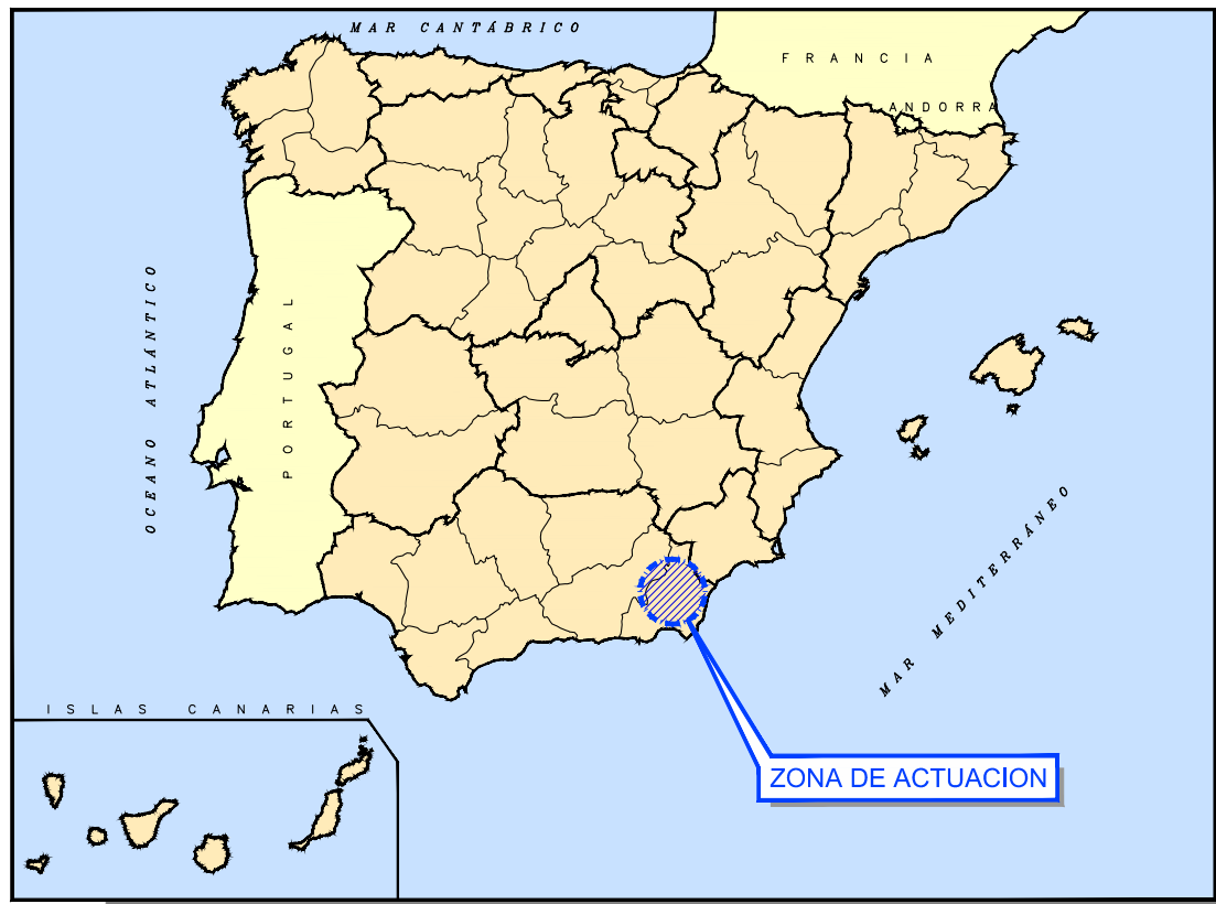
SITUACIÓN GEOGRÁFICA SIN ESCALA