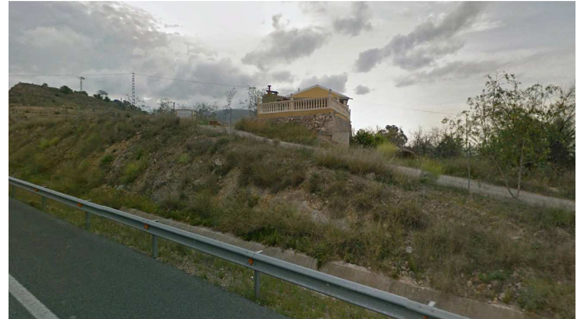
Patio a expropiar. Ref. Catastral: D61D02600XH61D

Se afecta al patio de un (1) edificio en suelo rural, con referencia catastral D61D02600XH61D, en el término municipal de Santomera. El patio está elevado y deberá reponerse el muro de contención que lo circunda.