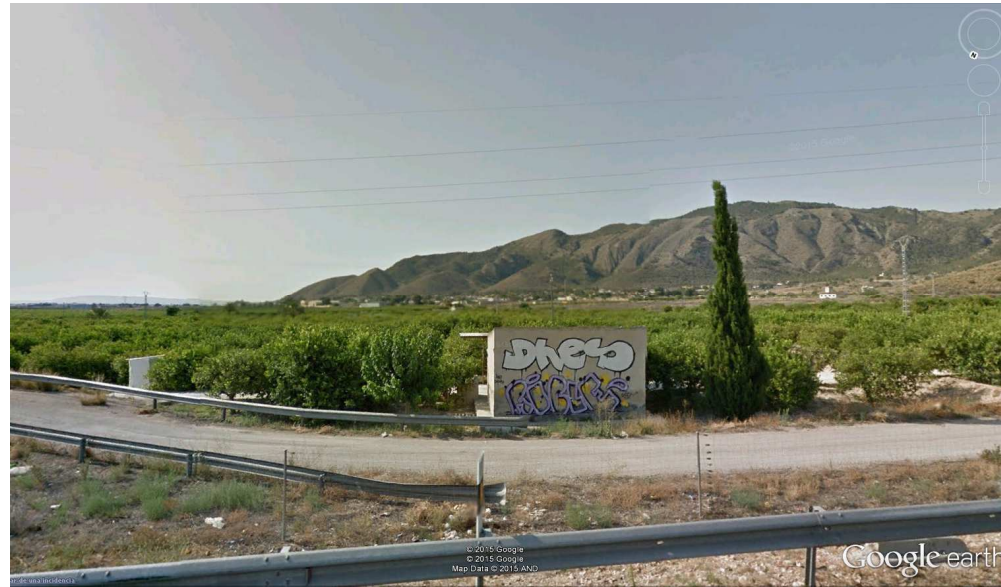
Caseta afectada. Ref. Catastral: 03099A03100076

También se afecta una caseta en la parcela 03099A03100076, de 15 m 2 .