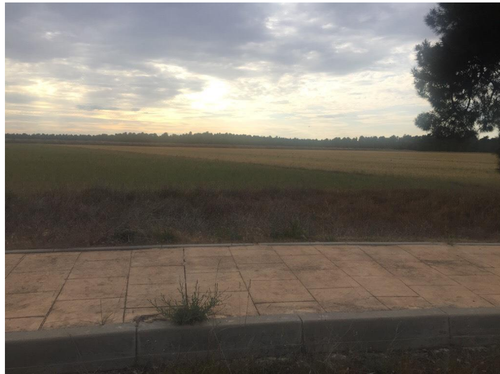
Imagen 6484 interfaz de cereal de secano con plantaciones de pino resinero alternativa 5 P.K. 7+100