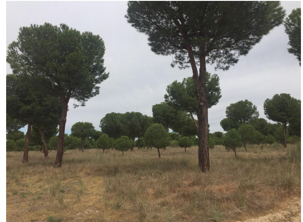
Imagen 6414 Pinares de piñonero y resinero en Espinosa de los Caballeros. Alternativas 6/7 P.K. 0 + 500