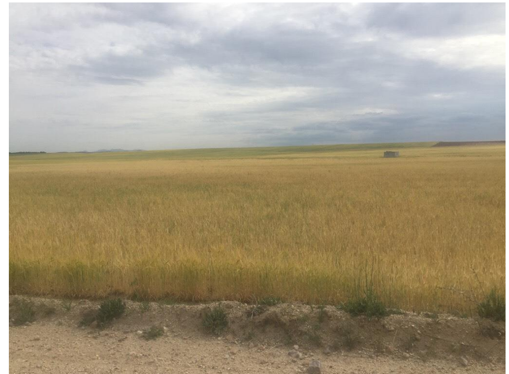
Imagen 6464. Estepa de secano alternativa 5 P.K. 11+400