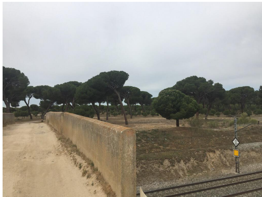
Imagen 6413. Enlace en Espinosa de los caballeros con A-6. Ferrocarril del norte en paso inferior Alternativa 6, inicio de la traza