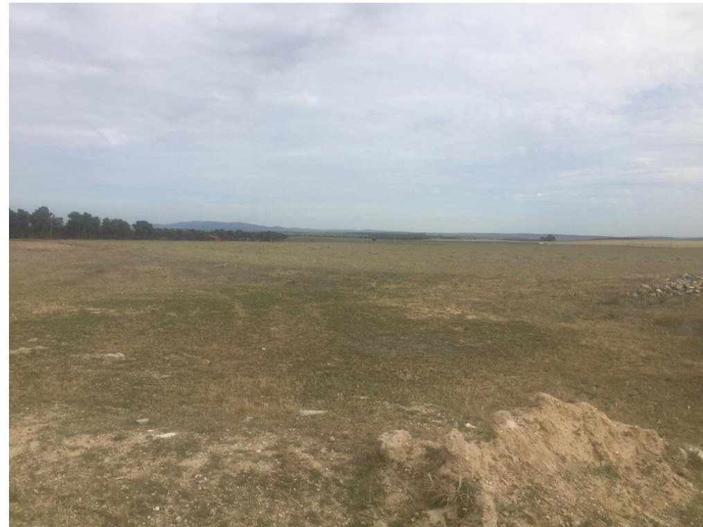
Imagen 6420 Pino resinando. Alternativa 7 P.K. 8 +000