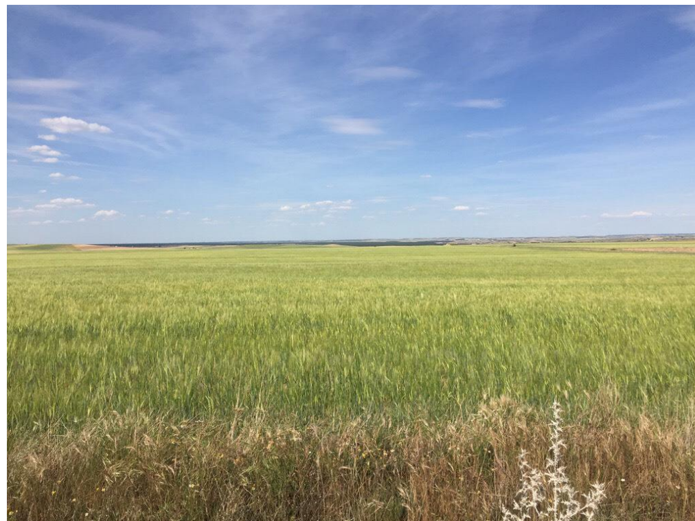
Imagen 6453 Zona de cultivo corresponde con la alternativa 3 P.K. 18+000, alternativa 5 P.K. 16+300 y alternativa 6 P.K. 21+700