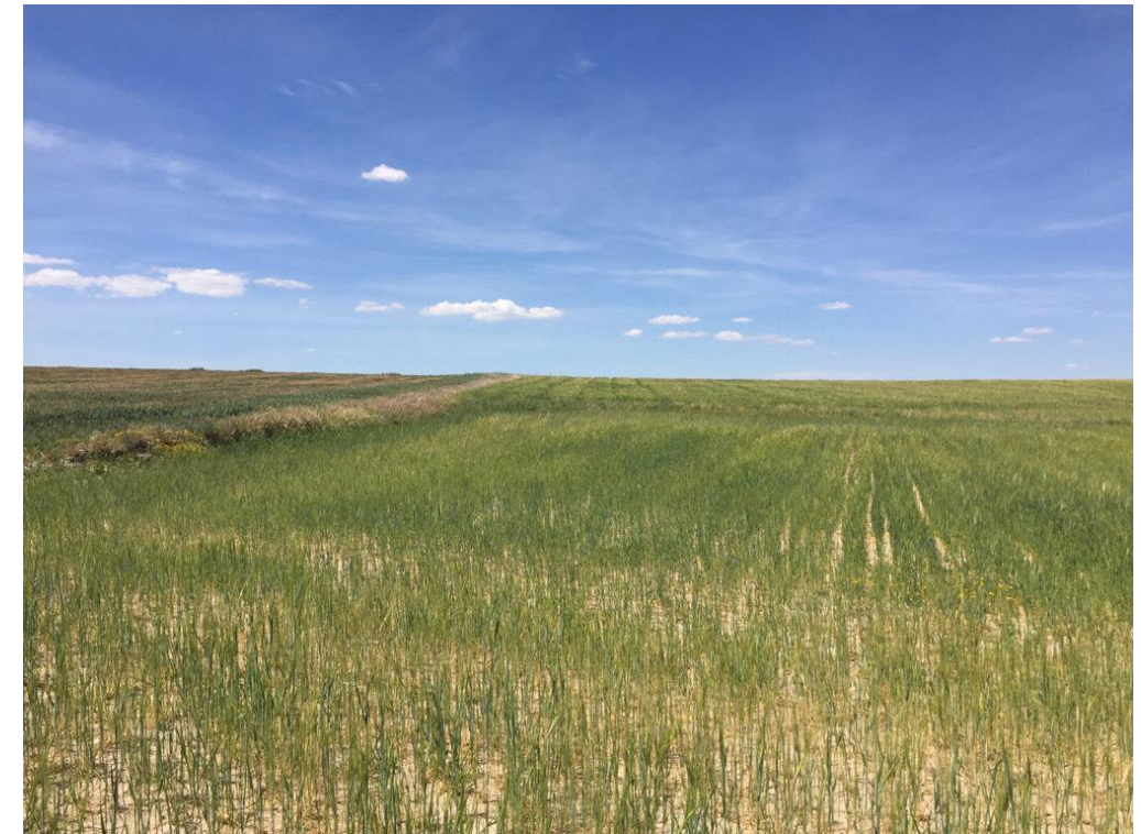
Imagen 6436. Vegetación de ribera pionera en vaguada sobre matriz agrícola de secano. Alternativa 7 P.K. 19+900