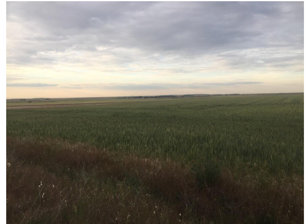
Imagen 6490 Cereal de secano con vaguada Alternativa 3 entorno al P.K. 10+400