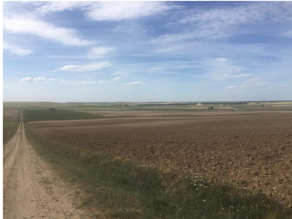
Imagen 6453 Zona de cultivo corresponde con la alternativa 3 P.K. 18+000, alternativa 5 P.K. 16+300 y alternativa 6 P.K. 21+700