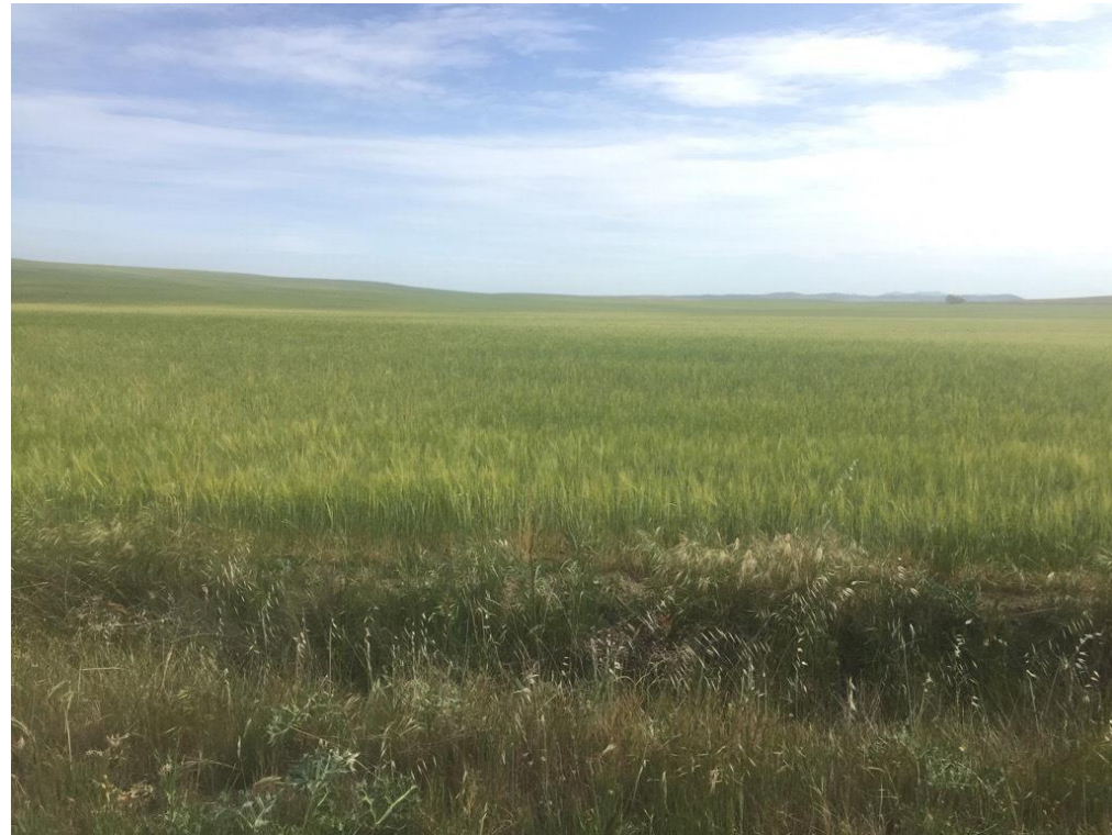
Imagen 6456. Cultivos de secano corresponde con las alternativas 5 P.K. 14+500 y 6 P.K. 19+900