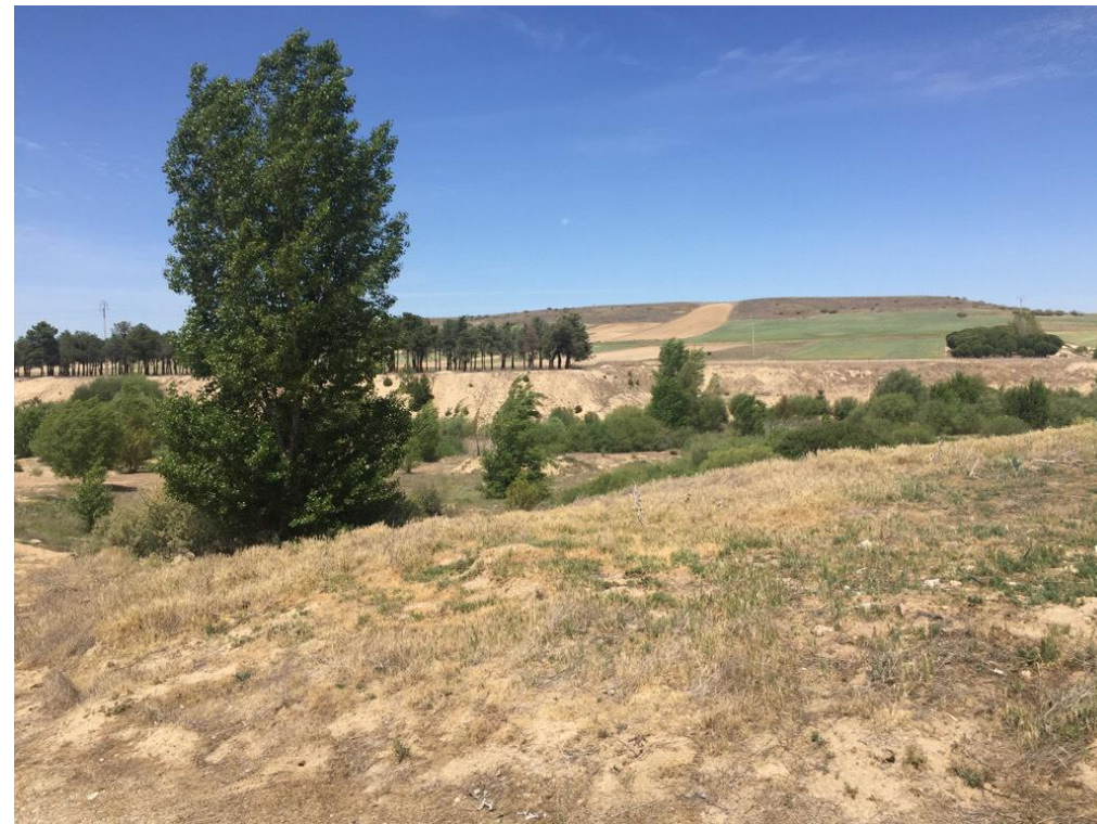
Imagen 6430. Canteras de extracción de áridos higrófila. Alternativa 7 P.K.14+400