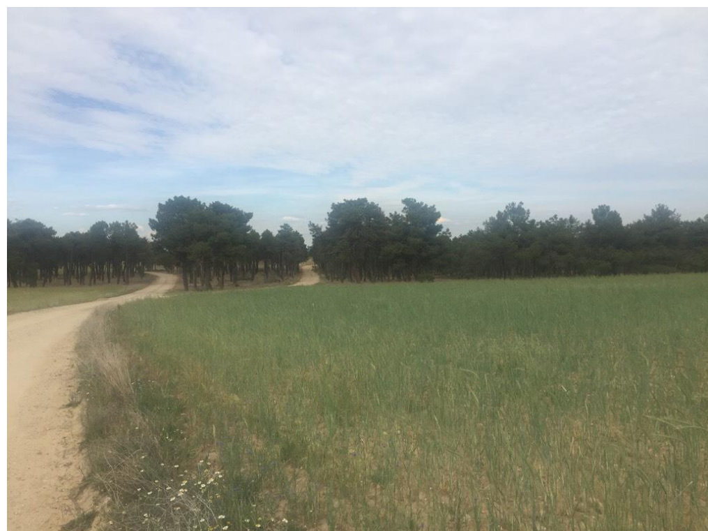
Imagen 6467 interfaz de cereal de secano con plantaciones de pino resinero. Caminos de graveras. Alternativa 5 P.K. 10+000