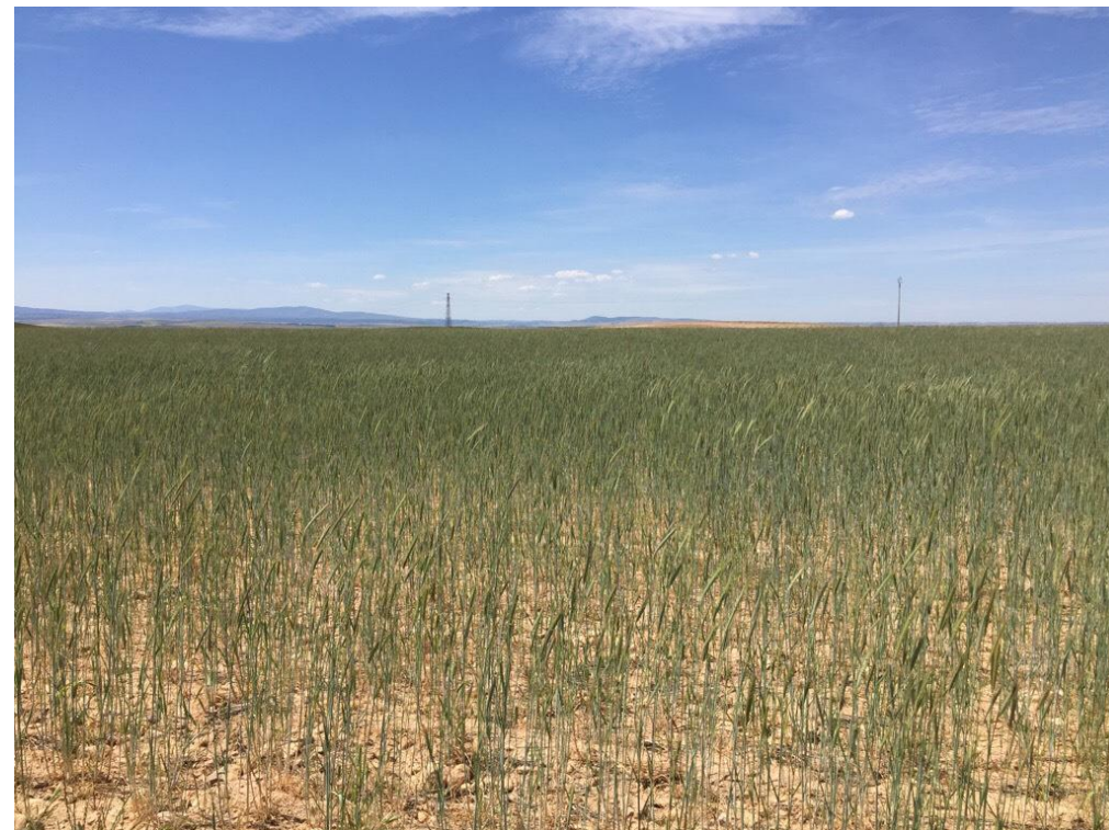
Imagen 6434. Cultivo de secano. Alternativa 7 P.K. 17+100