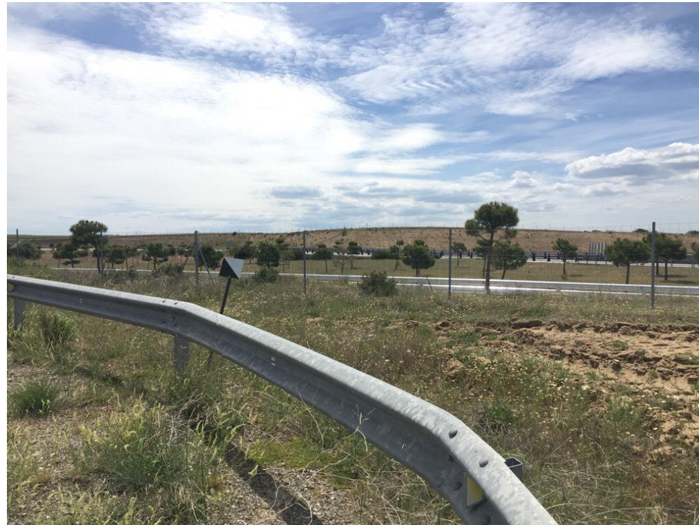
Imágenes 6499 y 6495 zona de estepa de cereal correspondiente con las alternativa 5 P.K. 2+400 y P.K.4+400