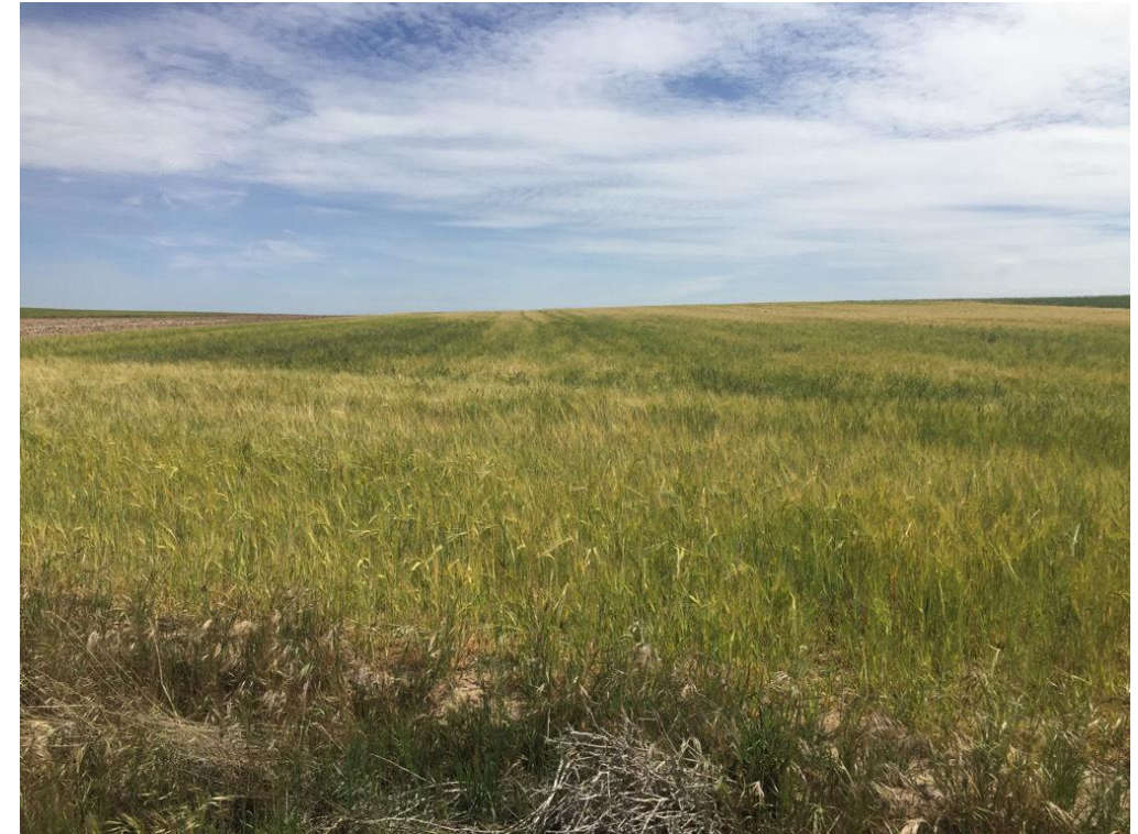
Imagen 6446 Vaguada y vegetación de ribera incipiente correspondiente con la alternativa 3 P.K.24+400, la alternativa 5 P.K. 22+700 y la alternativa 6/7 P.K. 28+100