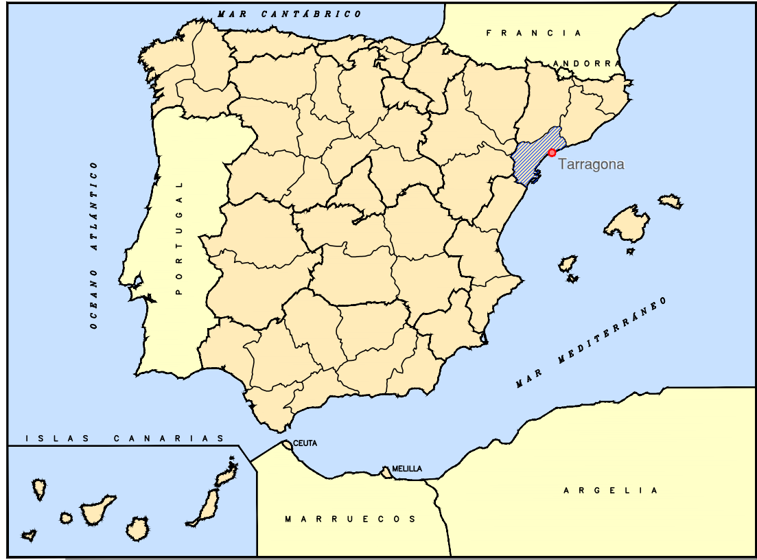
SITUACIÓN GEOGRÁFICA SIN ESCALA

P:\2015\150568\02_doc_tecnica\02.03_EJECUCION\GRAFICOS\04_ProjecTrazadoV100-Sup\02_Planos\02_Situacion\02H01.dwg