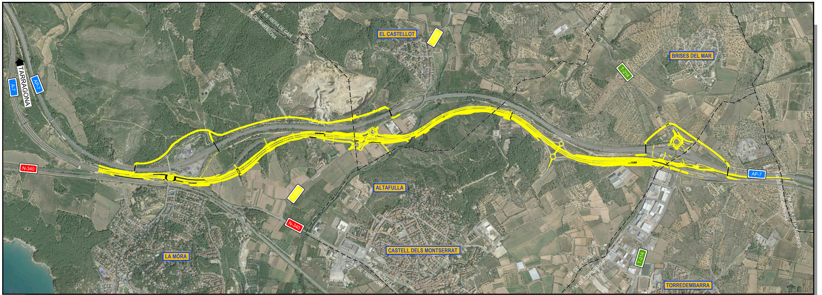
PLANO DE SITUACIÓN ESCALA 1/10.000